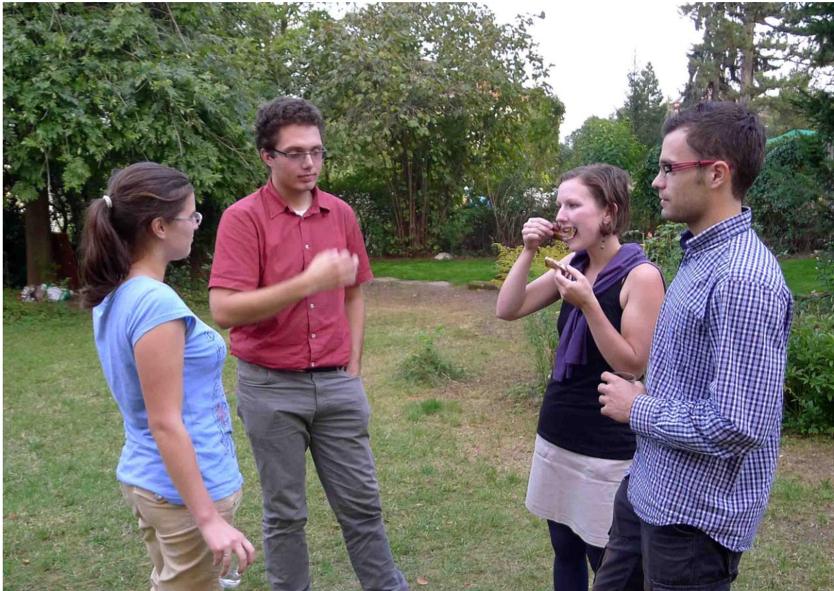
Pele, Trumšaj, Myriam, Rout