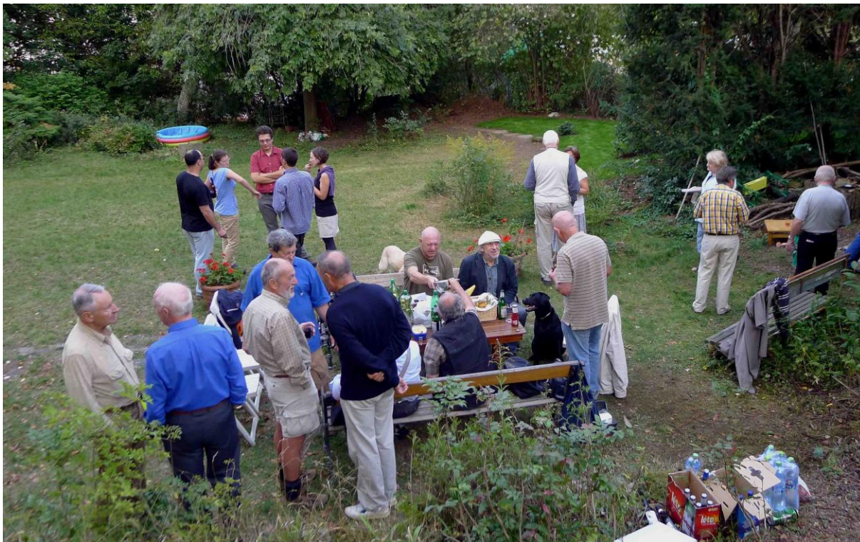
Tady je ta naše sešlost