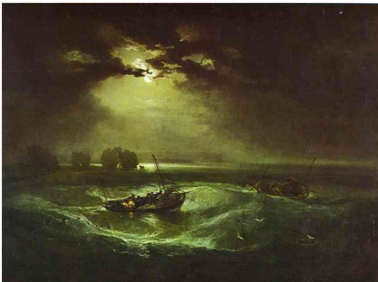
William Turner „Fishermen at Sea“